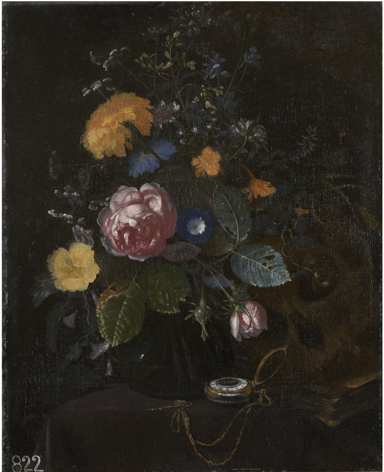
Matthias Withoos, Bloemstilleven met horloge en schedel , olieverf op doek, 47,7 x 38,9 cm, gesigneerd: 'MWithoos', Royal Collection

Londen werd verkocht. 10 ( /node/198#voetnoten ). Sindsdien is onbekend waar het schilderij is gebleven.