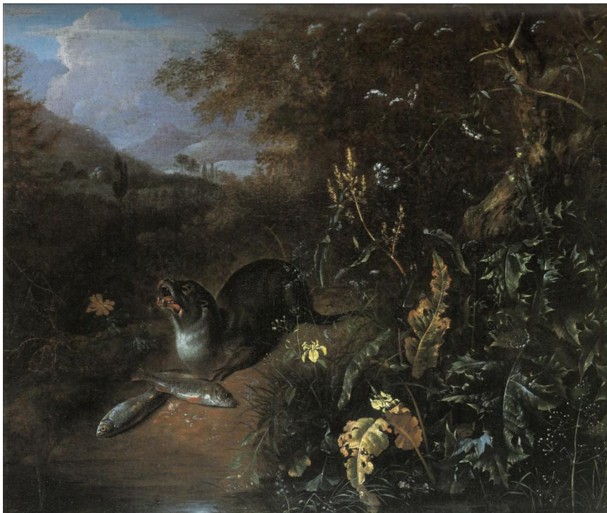
Matthias Withoos, Bosstilleven met een otter en twee vissen , olieverf op doek, 44,5 x 51,5 cm, gesigneerd en gedateerd: 'M. Withoos 1665', veiling Londen (Sotheby's)