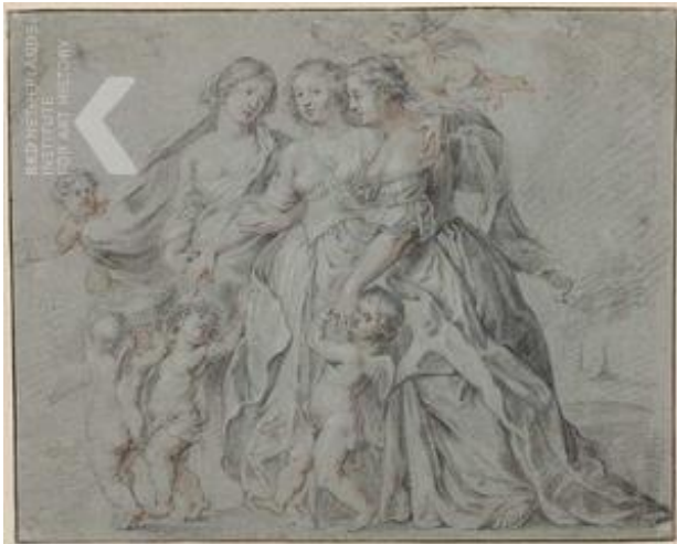
after Peter Paul Rubens The three Graces , 17de eeuw Moscow, Pushkin Museum, inv./cat.nr. 7097 preref 231138