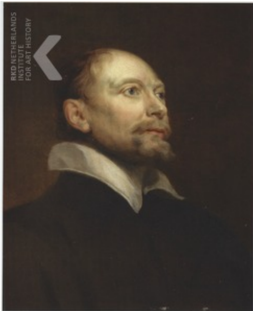
attributed to Anthony van Dyck Portrait of an unknown man, ca. 1625-1627 Christie's (New York City) 2011-01-26, nr. 121 priref 231134