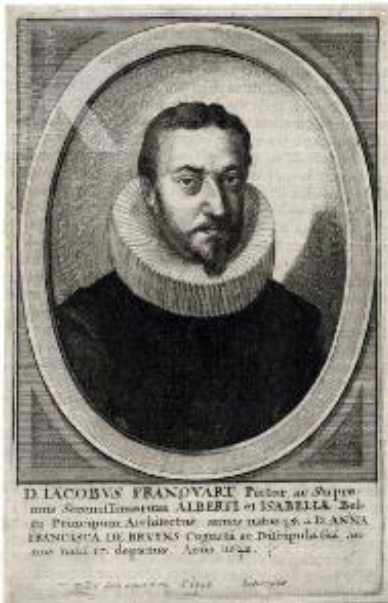
Wenzel Hollar after Anna Francisca de Bruyns Portrait of Jacques Franckaert (....-1651), 1648 gedateerd London, National Portrait Gallery, inv./cat.nr. NPG D42297 preref 233125