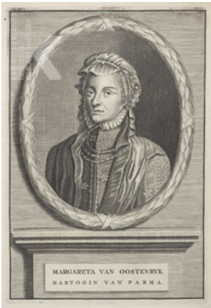
after Antonio Moro, Portret van Margaretha van Habsburg (1522-1586), 1677 of iets eerder