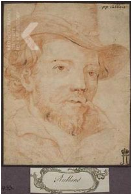
after Peter Paul Rubens , Portret van Peter Paul Rubens, eerste helft 18de eeuw Moscow, Pushkin Museum, inv./cat.nr. 7094