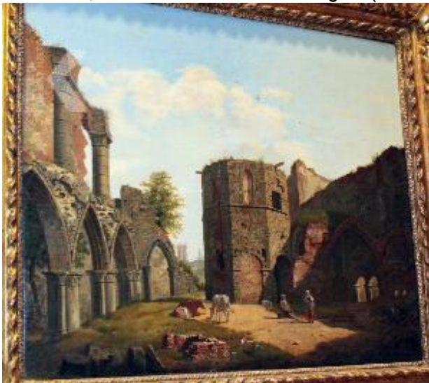
Anoniem Zuidelijke Nederlanden (historische regio) eerste helft negentiende eeuw Ruins of the Sint-Baafsabdij in Gent, eerste helft negentiende eeuw Whereabouts unknown preref 233225