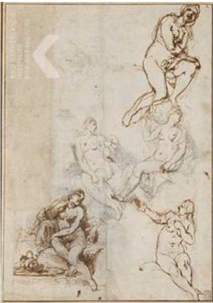
Anoniem Zuidelijke Nederlanden (historische regio) 17de eeuw , Studie van vijf vrouwelijke naakten, 17de eeuw Moscow, Pushkin Museum, inv./cat.nr. 13319