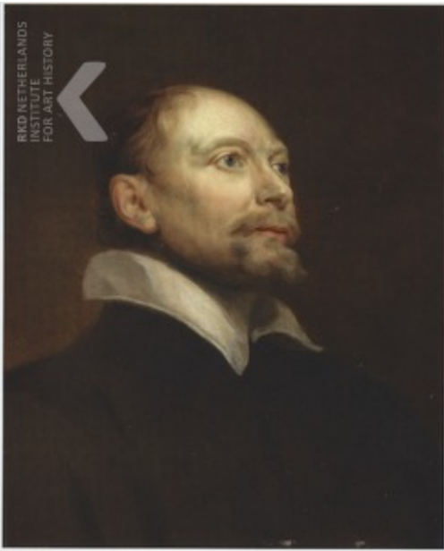
attributed to Anthony van Dyck , Portret van een onbekende man, ca. 1625-1627 Christie's (New York City) 2011-01-26, nr. 121