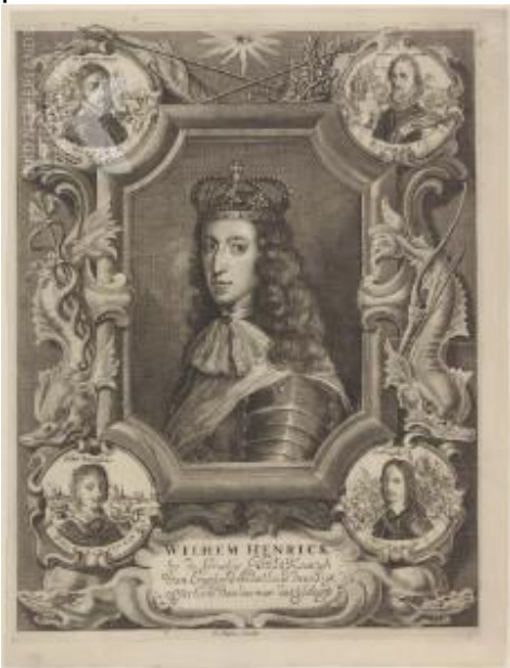
Anoniem ca. 1673 published by Johannes Tangena (17de eeuw) , Portret van Willem III van Oranje-Nasseu (1650-1702), ca. 1673 The Hague, RKD - Nederlands Instituut voor Kunstgeschiedenis (Collectie Iconografisch Bureau)