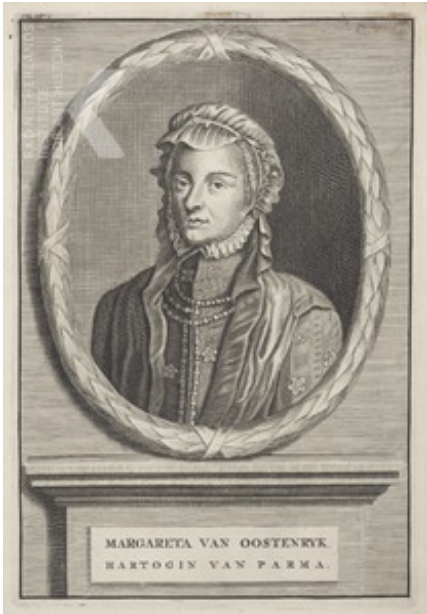
after Antonio Moro Portrait of Margaretha van Habsburg (1522-1586), 1677 of iets eerder