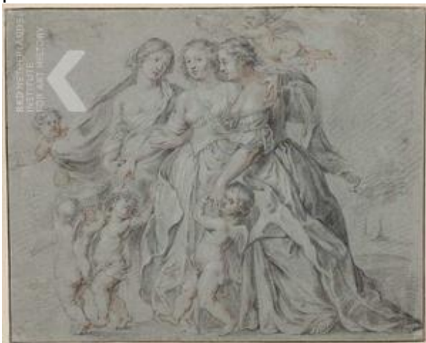
after Peter Paul Rubens , De drie Gratiën, 17de eeuw Moscow, Pushkin Museum, inv./cat.nr. 7097 1 2 3 4 5 6 7 8 9 > >>