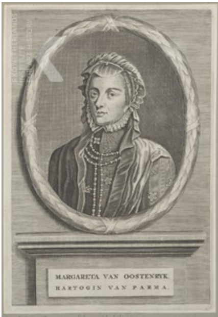
after Antonio Moro , Portret van Margaretha van Habsburg (1522-1586), 1677 of iets eerder The Hague, RKD - Nederlands Instituut voor Kunstgeschiedenis (Collectie Iconografisch Bureau)