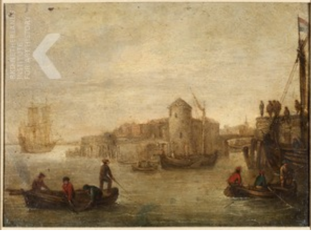
Anoniem Noordelijke Nederlanden (historische regio) midden zeventiende eeuw , Hollands havengezicht, midden zeventiende eeuw Private collection