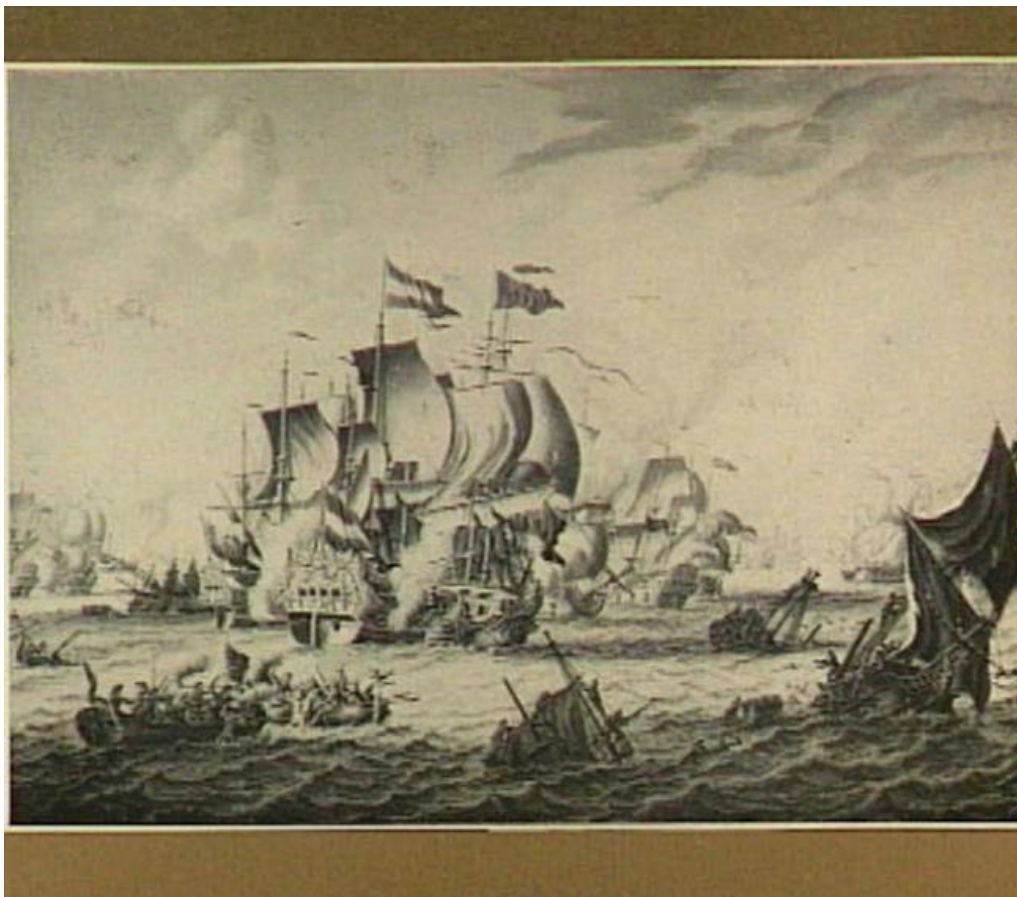
Afbeeldingsnummer 0000020588 Afmetingen: 650x568 pixels