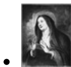
Anthony van Dyck, Maria als Mater Dei (pendant)