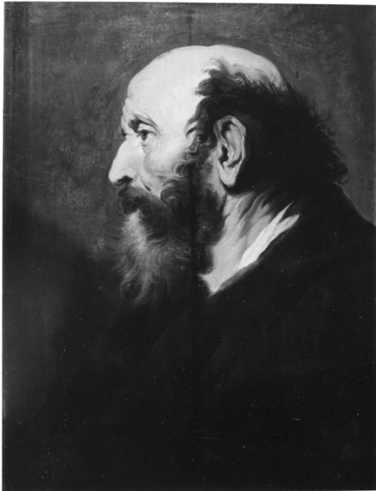
Afbeeldingsnummer 0000131739 Afmetingen: 1904x2453 pixels License undetermined