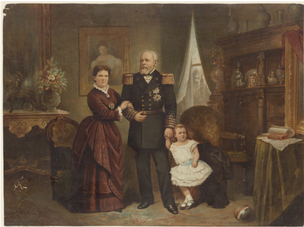
Afbeeldingsnummer 0000214630 Afmetingen: 7700x5726 pixels

Portret van koning Willem III (1817-1890), koningin Emma (1858-1934) en prinses Wilhelmina (1880-1962), ca. 1883 The Hague, RKD – Nederlands Instituut voor [...]