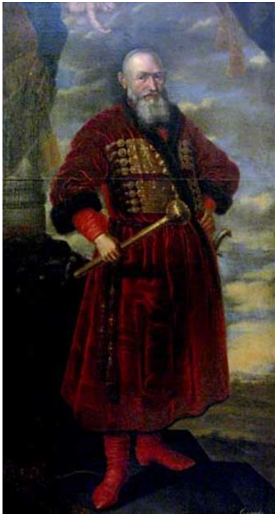
Afbeeldingsnummer 0000354777 Afmetingen: 349x650 pixels License undetermined