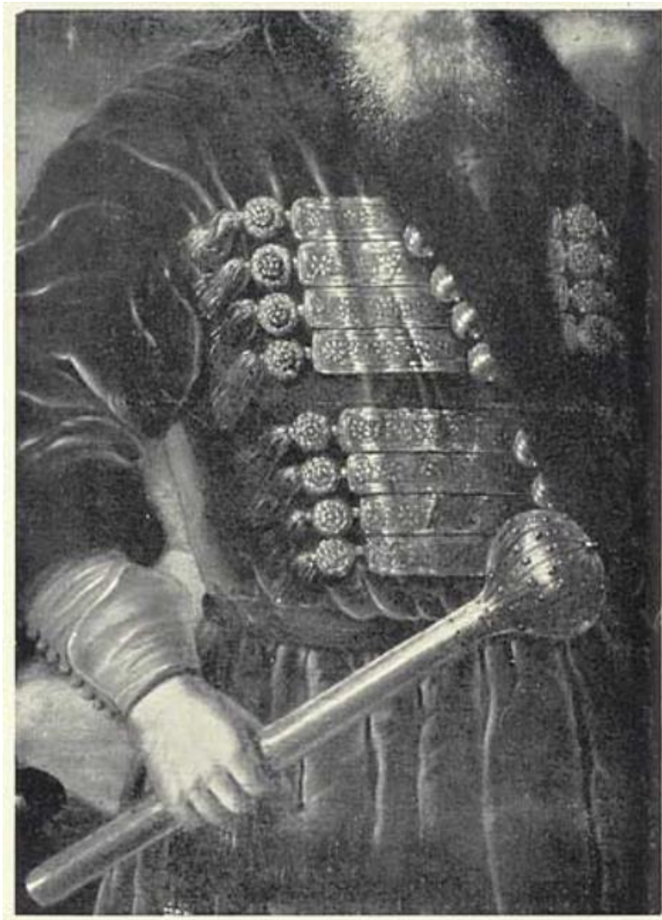
Afbeeldingsnummer 0000354774 Afmetingen: 470x650 pixels License undetermined