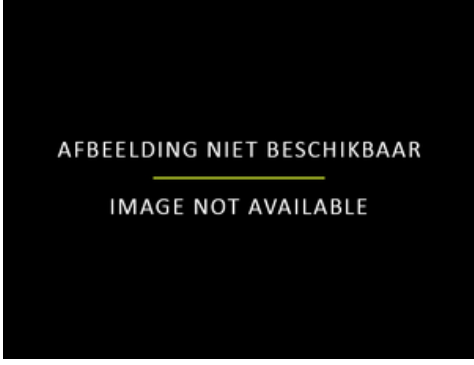
als voorbeeld gebruikt voor after Peter Paul Rubens, Bewening van Christus