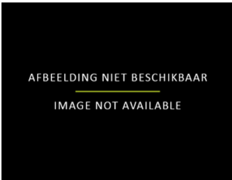
als voorbeeld gebruikt voor Eugène Delacroix, Bewening van Christus