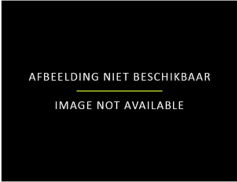
als voorbeeld gebruikt voor after Peter Paul Rubens, Bewening van Christus