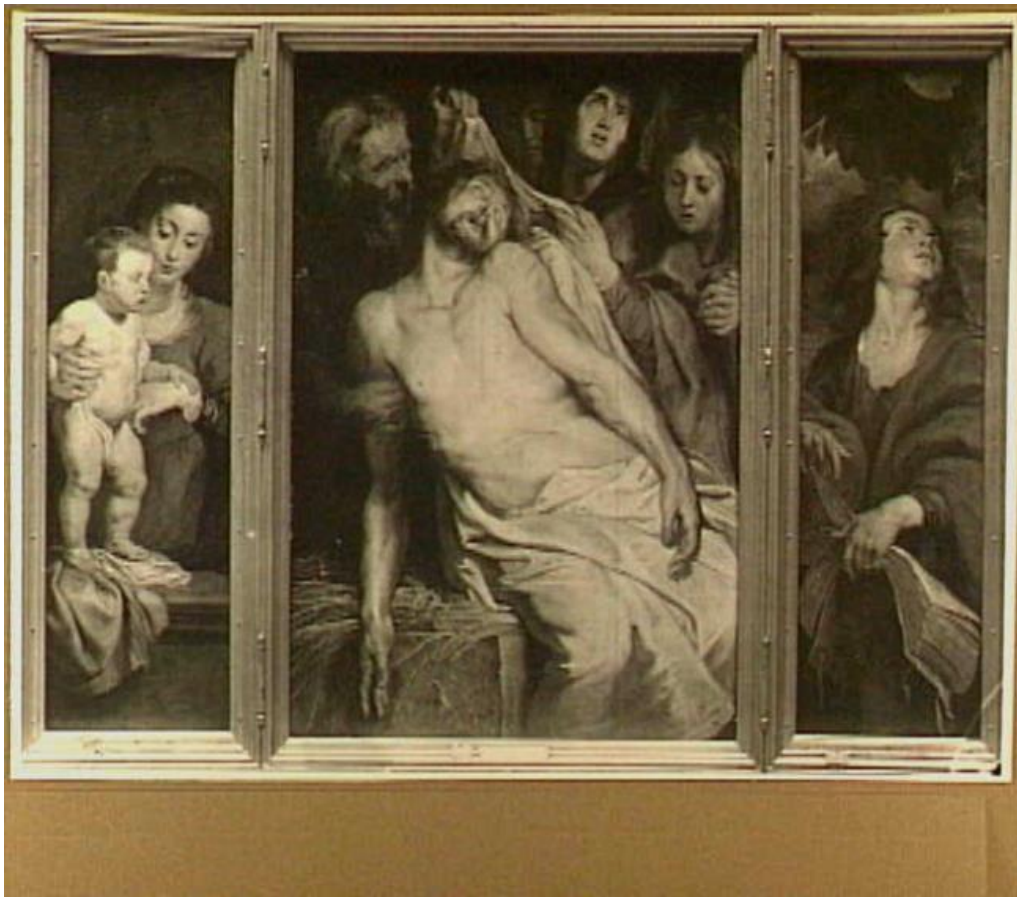
Afbeeldingsnummer 0000050954 Afmetingen: 650x568 pixels