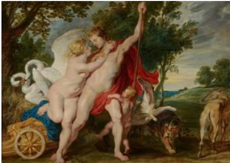
verwant aan after Peter Paul Rubens, Venus tracht Adonis te weerhouden van de jacht