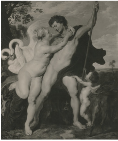
herhaling van Peter Paul Rubens, Venus tracht Adonis te weerhouden van de jacht