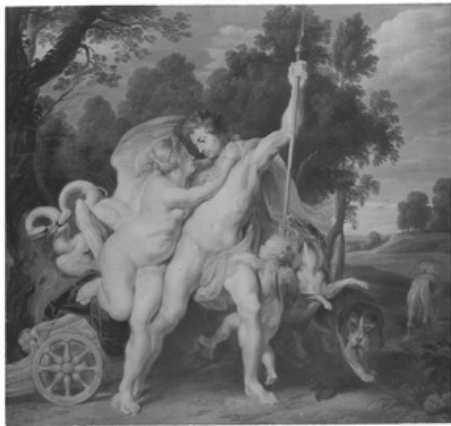
verwant aan after Peter Paul Rubens, Venus tracht Adonis te weerhouden ter jacht te gaan