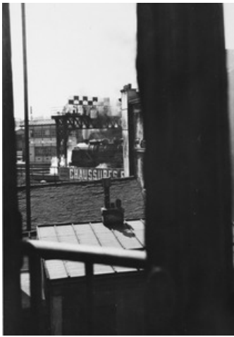
motief/motieven overeenkomstig met László Moholy-Nagy, Gare Montparnasse, uitzicht vanuit Piet Mondriaans atelier