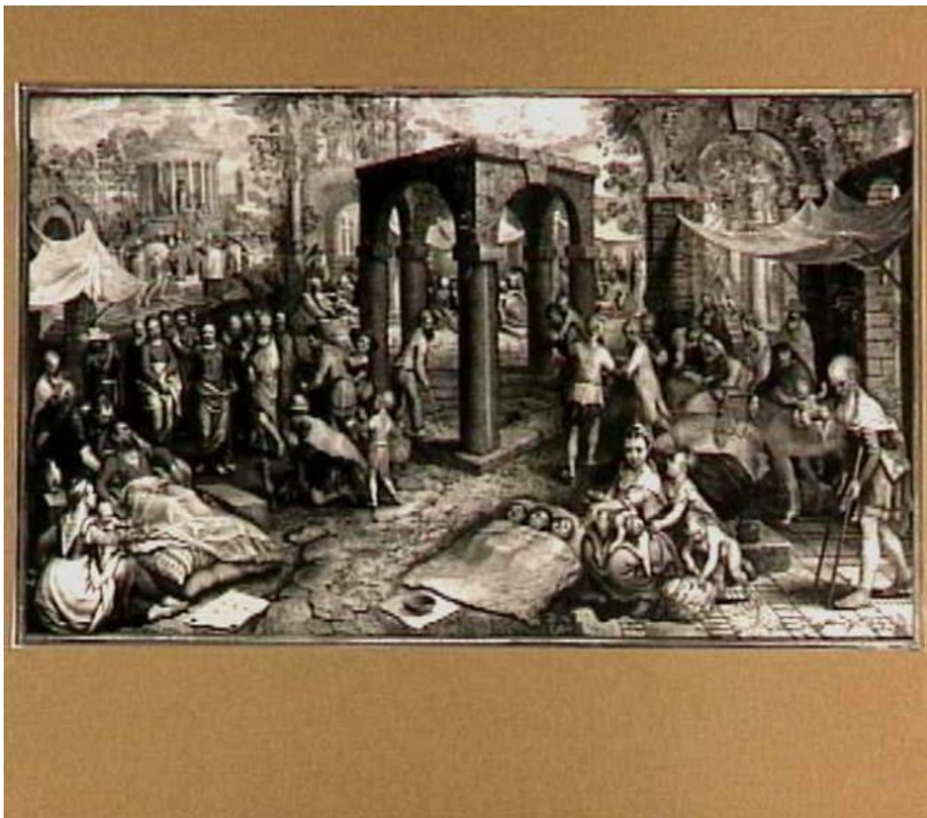
Afbeeldingsnummer 000003825 Afmetingen: 650x568 pixels