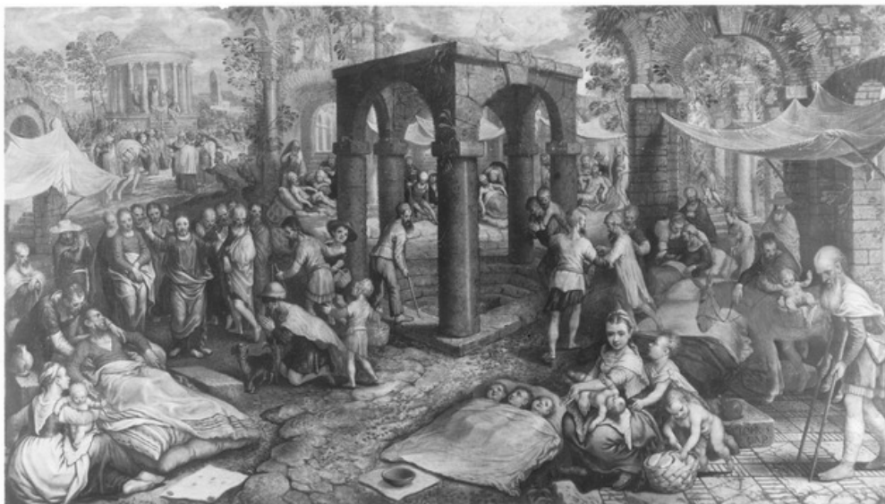
Afbeeldingsnummer 0000075291 Afmetingen: 4943x2858 pixels