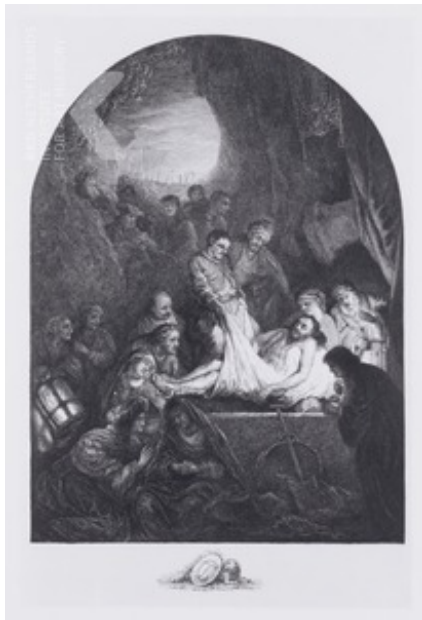
in prent gebracht door Carl Ernst Christoph Hess, De Graflegging