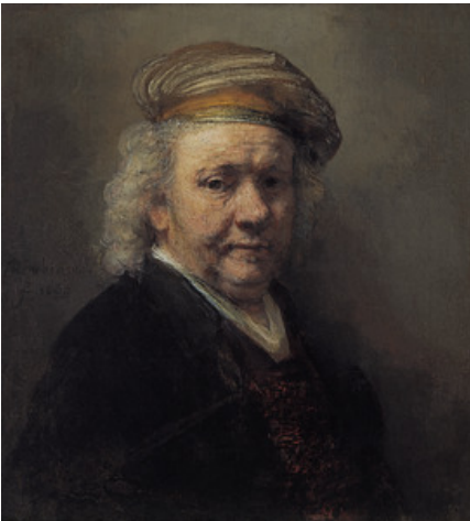
Rembrandt , Zelfportret, 1669 gedateerd Den Haag Koninklijk Kabinet van Schilderijen Mauritshuis inv./cat. nr. 840