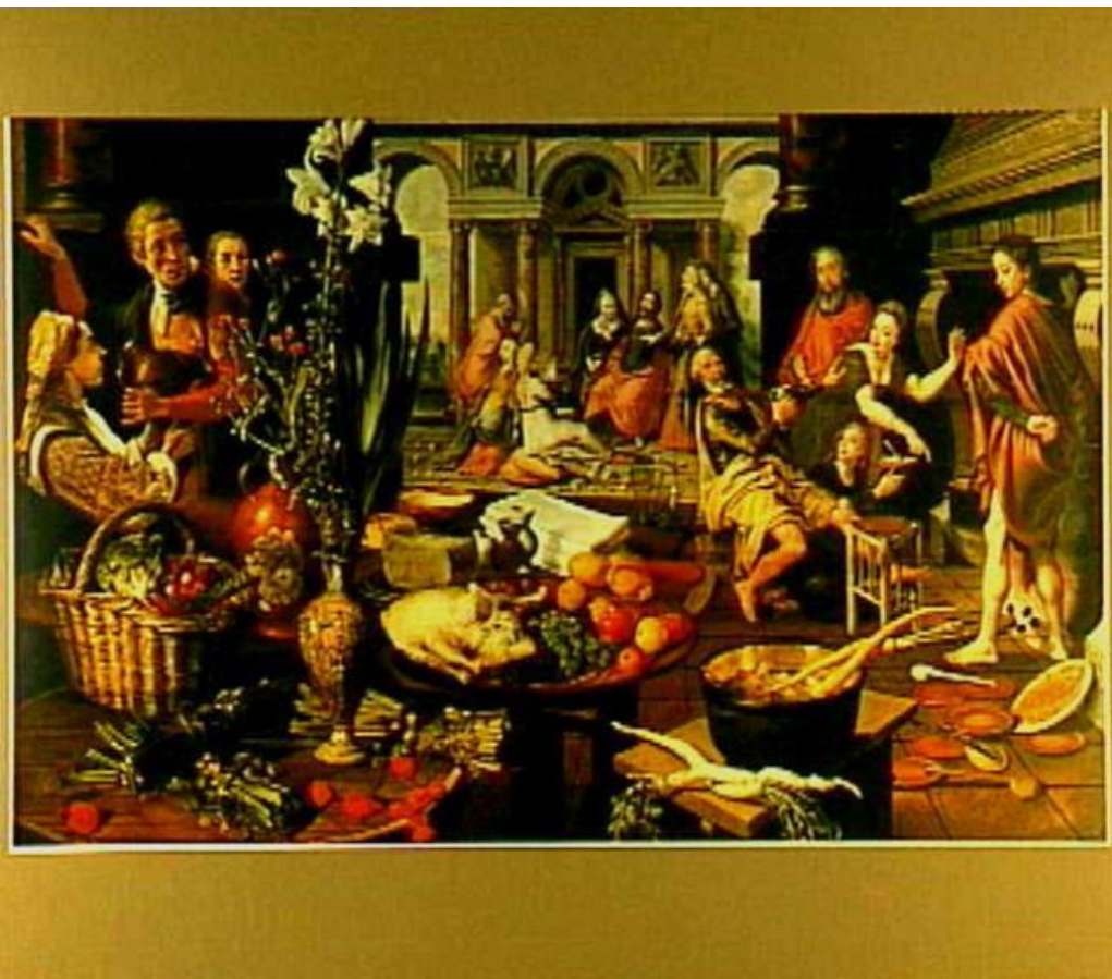
Afbeeldingsnummer 0000012235 Afmetingen: 650x568 pixels License undetermined