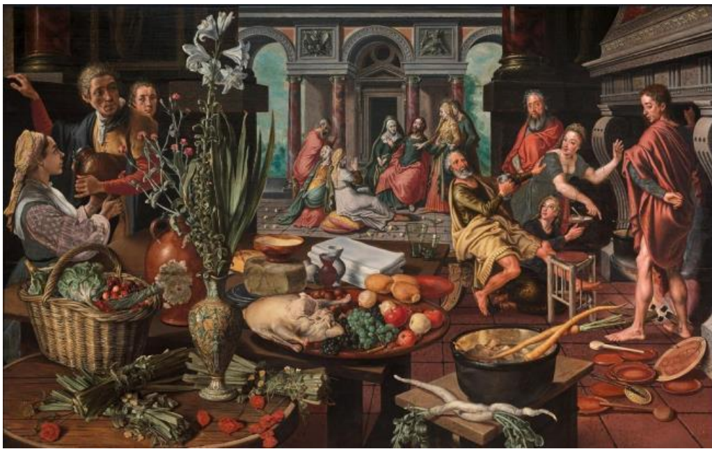
Afbeeldingsnummer 1001616085 Afmetingen: 650x406 pixels License undetermined

Christus in het huis van Martha en Maria (Lucas 10:38-42), 1553 gedateerd Rotterdam, Museum Boijmans Van Beuningen, [..]