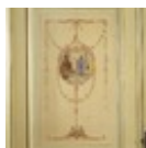
H.J.A. Buschenhenke, De profeet Natan verwijt koning David zijn kwalijke gedrag (2 Samuel 12:1-25) (part of a decoration scheme)