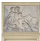
G. van den Pol, Allegorie op de vergankelijkheid (part of a decoration scheme)