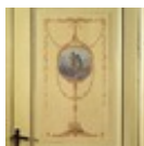
H.J.A. Buschenhenke, David en Abisai treffen een slapende Saul, waarbij David Sauls leven spaart (1 Samuël 26:7-9) (part of a decoration scheme)