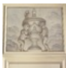
after G. van den Pol, Putti voor een vaas (part of a decoration scheme)