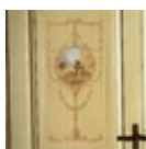
H.J.A. Buschenhenke, De barmhartige Samaritaan verzorgt de gewonde reiziger (Lucas 10:30-34) (part of a decoration scheme)