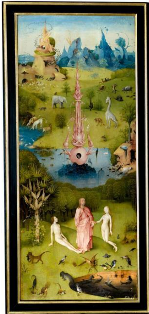
Afbeeldingsnummer 1001616649 Afmetingen: 310x650 pixels License undetermined