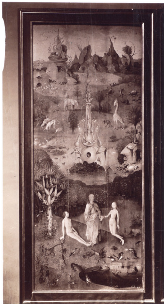
Afbeeldingsnummer 0000111415 Afmetingen: 1560x2849 pixels License undetermined