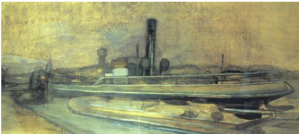
Afbeeldingsnummer 1001209763 Afmetingen: 650x287 pixels Licentie onder PUB DOM

Steam-driven ferry moored on the Weesperzijde, ca. eind 1907-1908 Private collection