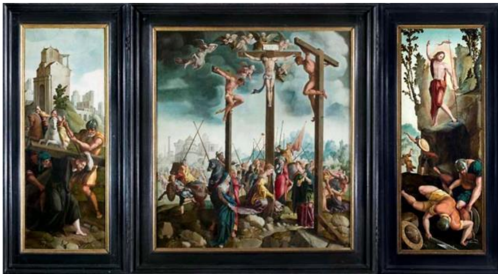
Afbeeldingsnummer 1000310468 Afmetingen: 650x353 pixels Licentie onder PUB DOM