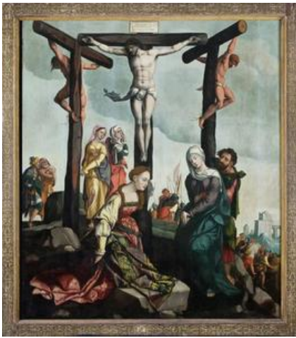
(vrijwel) identiek met after Jan van Scorel, De kruisiging