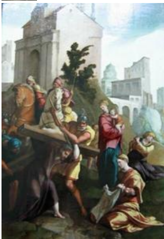
(vrijwel) identiek met after Jan van Scorel, De kruisdraging