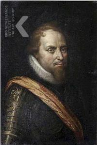
naar Michiel van Mierevelt , Portret van Maurits van Oranje-Nassau (1567-1625), na 1607 Bonhams (Oxford (England)) 2012-11-28, nr. 243