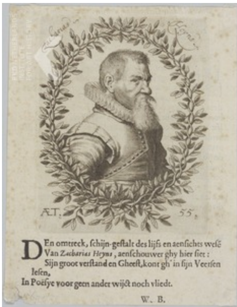
Anoniem na 1620 , Portret van Zacharias Heyns (...-1640), na 1620 The Hague, RKD - Nederlands Instituut voor Kunstgeschiedenis (Collectie Iconografisch Bureau)