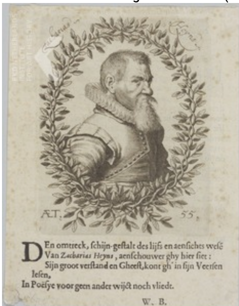
Anoniem na 1620 Portret van Zacharias Heyns (...-1640), na 1620 The Hague, RKD - Nederlands Instituut voor Kunstgeschiedenis (Collectie Iconografisch Bureau) priref 233396