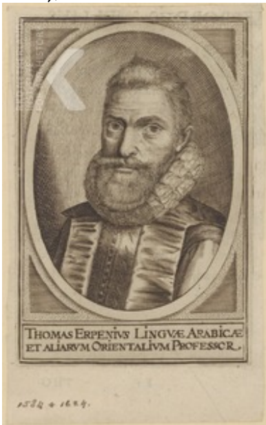
Anoniem ca. 1614