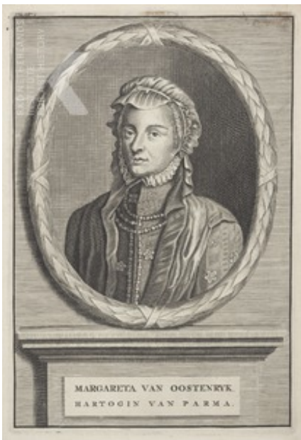
naar Antonio Moro , Portret van Margaretha van Habsburg (1522-1586), 1677 of iets eerder The Hague, RKD - Nederlands Instituut voor Kunstgeschiedenis (Collectie Iconografisch Bureau)