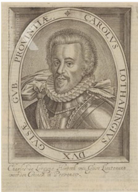
Anoniem ca. 1614, Portret van Charles de Lorraine, duc de Guise (1571-1640), ca. 1614