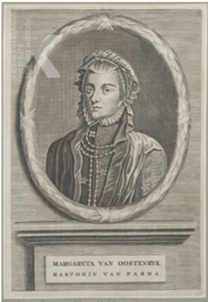
naar Antonio Moro , Portret van Margaretha van Habsburg (1522-1586), 1677 of iets eerder The Hague, RKD - Nederlands Instituut voor Kunstgeschiedenis (Collectie Iconografisch Bureau)