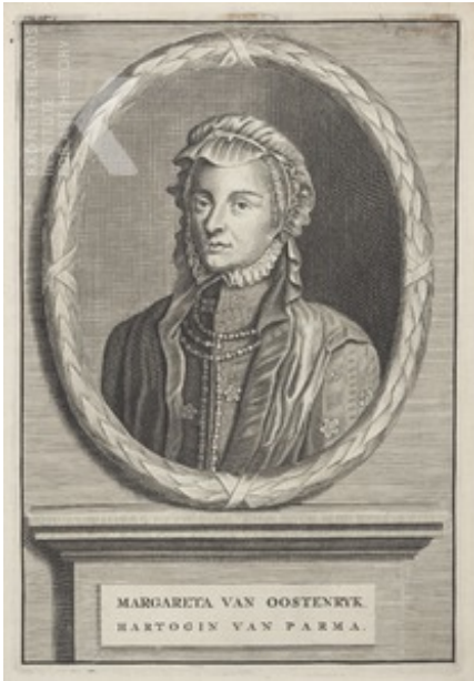
naar Antonio Moro Portret van Margaretha van Habsburg (1522-1586), 1677 of iets eerder The Hague, RKD - Nederlands Instituut voor Kunstgeschiedenis (Collectie Iconografisch Bureau) priref 231133