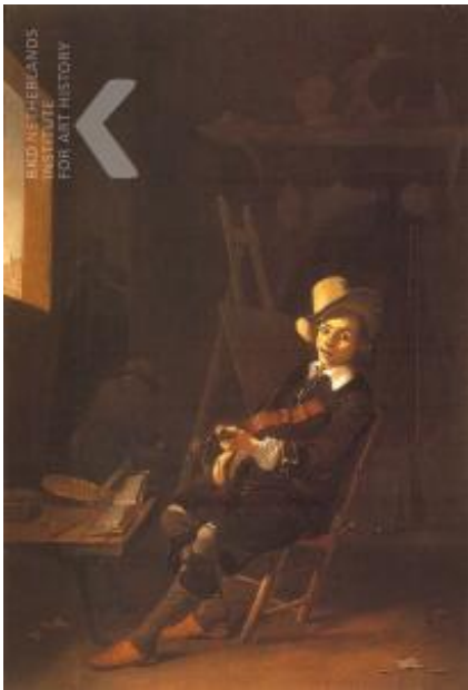
Johannes Lingelbach , Portret van een man, mogelijk een zelfportret, 1650 gedateerd Zurich, Kunsthaus Zürich - Stiftung Prof. Dr. L. Ruzicka, inv./cat.nr. R.56