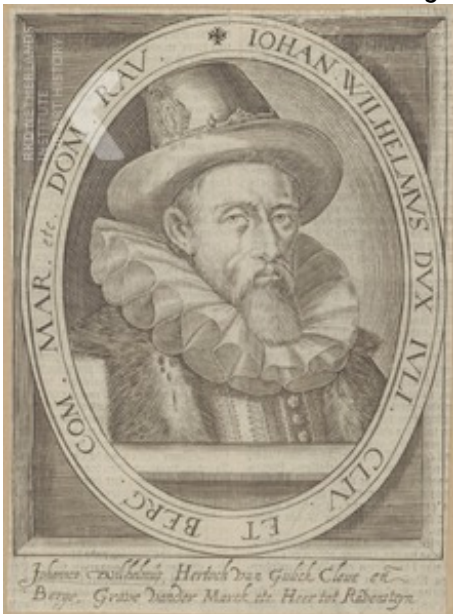
naar Johan Malthain Portret van Johann Wilhelm hertog van Gulik, Kleef en Berg (1562-1609), ca. 1614 The Hague, RKD - Nederlands Instituut voor Kunstgeschiedenis (Collectie Iconografisch Bureau) priref 233304