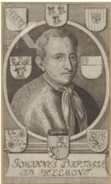
Georg Paul Busch , Portret van Jan Baptist van Helmont (1580-1644), The Hague, RKD - Nederlands Instituut voor Kunstgeschiedenis (Collectie Iconografisch Bureau)