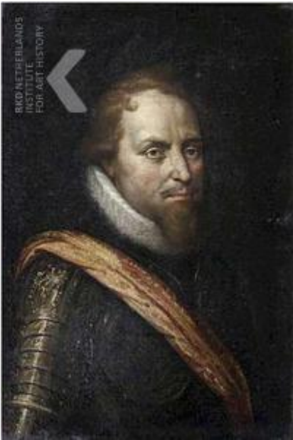
naar Michiel van Mierevelt Portret van Maurits van Oranje-Nassau (1567-1625), na 1607 Bonhams (Oxford (England)) 2012-11-28, nr. 243 preref 231177