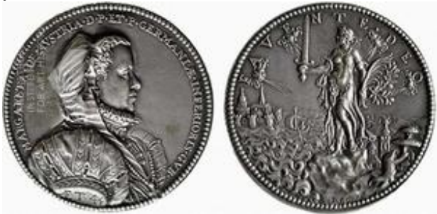
Jacques Jonghelinck , Portret van Margaretha van Habsburg (1522-1586), 1567 gedateerd Brussels, Koninklijke Bibliotheek van België