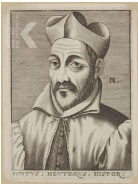
Nicolas de Larmessin (I) , Portret van Pontus Heuterus (1535-1602), ca. 1682 The Hague, RKD - Nederlands Instituut voor Kunstgeschiedenis (Collectie Iconografisch Bureau)