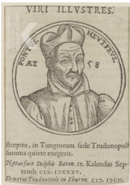
Anoniem ca. 1611 , Portret van Pontus Heuterus (1535-1602), ca. 1611 The Hague, RKD - Nederlands Instituut voor Kunstgeschiedenis (Collectie Iconografisch Bureau)